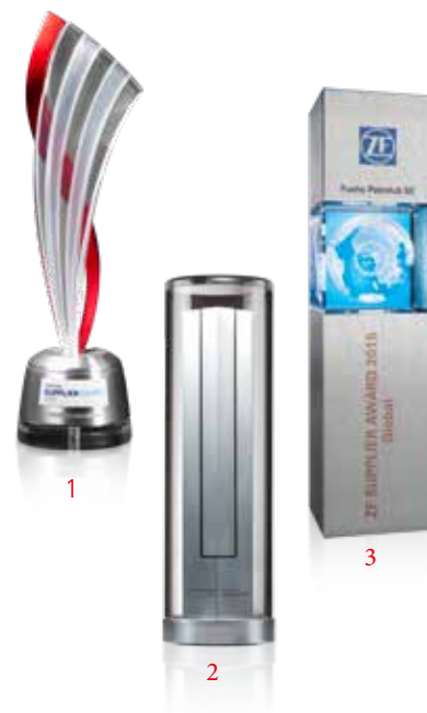
1 DAIMLER SUPPLIER AWARD